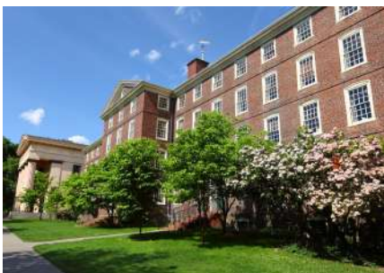
大学見学 University Tour