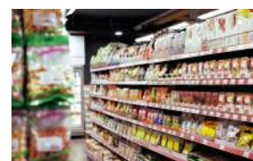
コンビニ Convenience Store