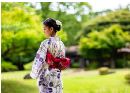
浴衣体験 Yukata Experience