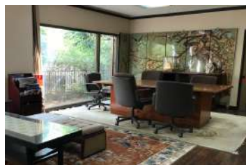
応接室 Meeting Room