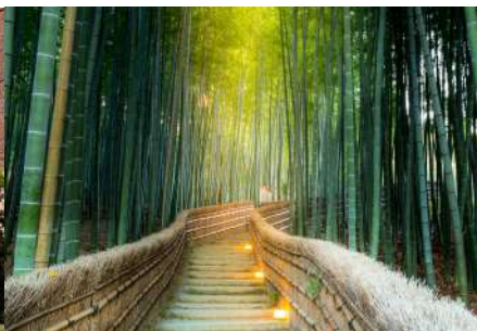
京都市内観光 Kyoto City Sightseeing