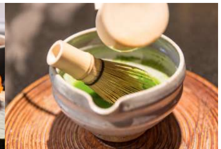
茶道体験 Tea Ceremony Experience