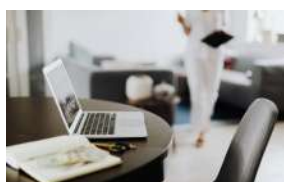
山科区役所 Yamasina Ward Office