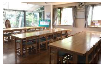
自習室 Study Room