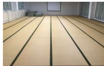
活動室 Activity Room