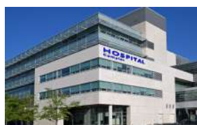
柳辻病院 Nagistuji Hospital