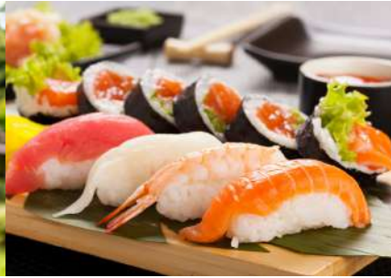
सुशी अनुभव Sushi Experience