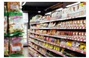
コンビニ Convenience Store