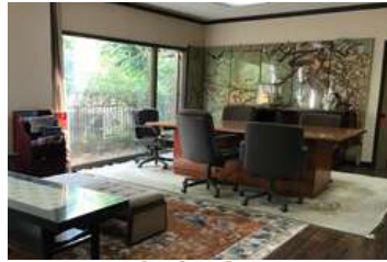
भेट्ने कोठा Meeting Room