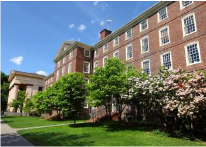
विश्वविद्यालय भ्रमण University Tour