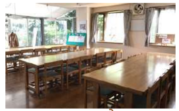
अध्ययन कोठा Study Room