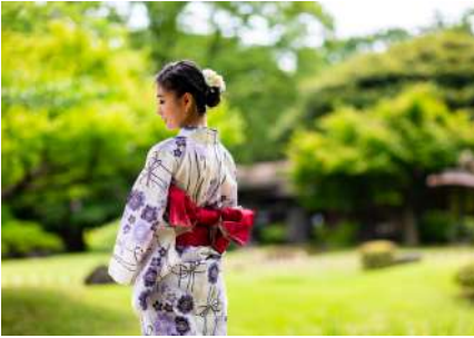
युकाता अनुभव Yukata Experience

Experience traditional Japanese culture and humanities