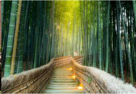
क्योटो शहर पर्यटन Kyoto City Sightseeing