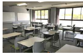
कक्षा कोठा Classroom