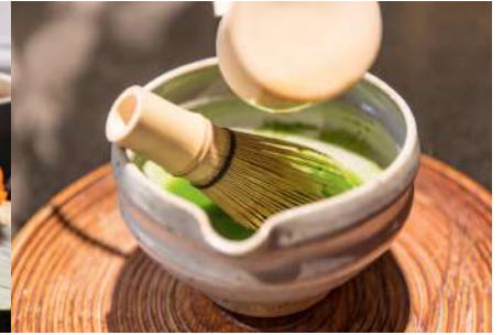
चिया समारोह अनुभव Tea Ceremony Experience