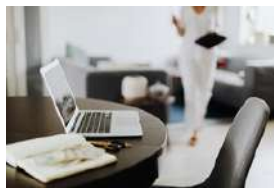
यामाशिना वार्ड कार्यालय Yamasina Ward Office