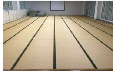
गतिविधि कोठा Activity Room