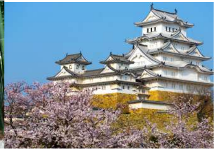
जापानी इतिहास अनुभव Japanese History Experience

जापानी भाषा अध्ययन गर्दै जापानी संस्कृतिको अनुभव लिनुहोस् र क्योटोको आकर्षणलाई प्रत्यक्ष रूपमा अनुभूति गर्नुहोस्।