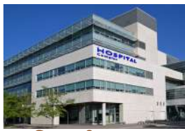
नागित्सुजी अस्पताल Nagistuji Hospital